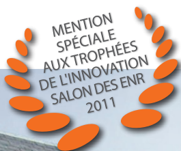
capteur thermique SLIMSOL